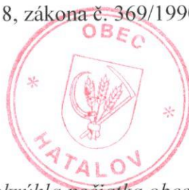
okružla pečiatka obce

Toto VZN bolo podľa § 6, ods. 8, zákona č. 369/1990 Z. z. vyvesené na úradnej tabuli obce od 14.11.2011 do 30.11.2011.